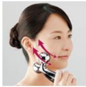
フェイスラインケア

顔や身体ラインに沿って、肌の柔らかい部分をつまみあげるように、両方向を基本としてローリング。